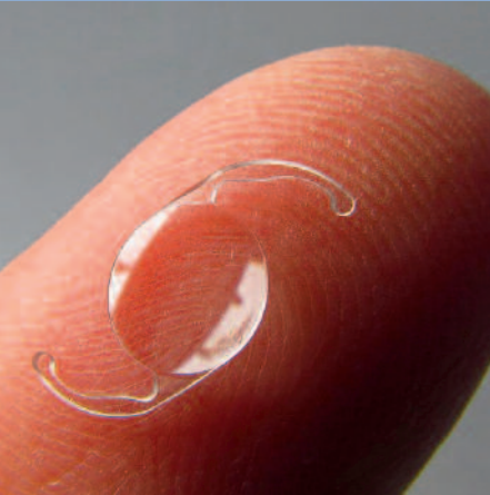
Kunstlinsenimplantat

Mit Karl von Rokitansky, Josef Skoda, Ignaz Philipp Semmelweis und vielen anderen hat die Wiener Schule der Medizin im 19. Jahrhundert die Diagnose und Behandlung von Krankheiten revolutioniert. Wien war in dieser Epoche richtungsweisend für die Entwicklung der modernen Medizin.